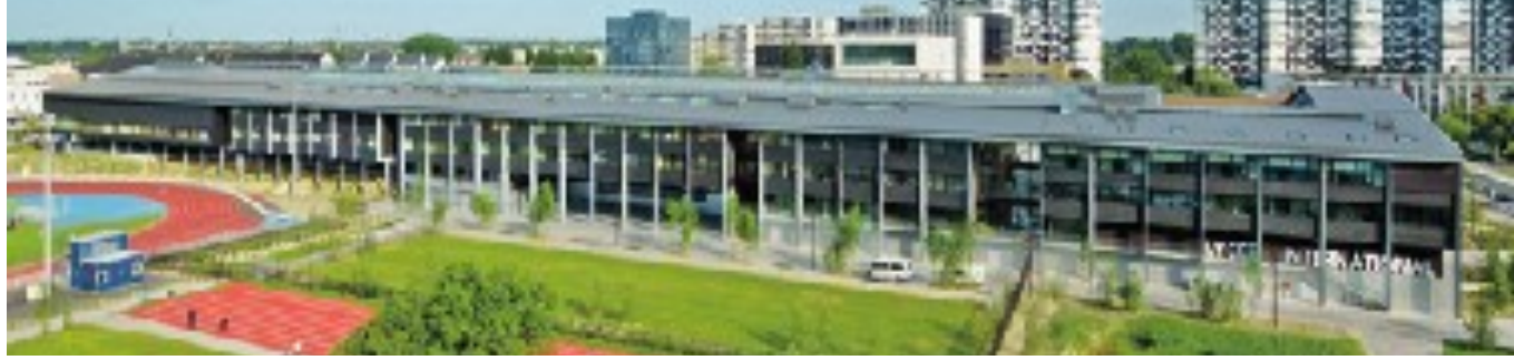
Lycée Nelson Mandela, Nantes