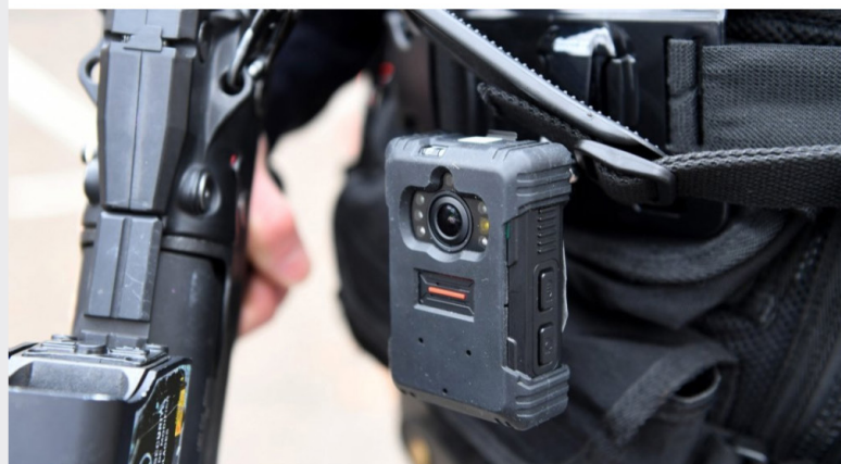
Un policier porteur d'une caméra-piéton lors d'une manifestation, à Bourg-en-Bresse (Ain), en janvier 2019.

Le ministère de l'Intérieur diffuse, lundi 16 novembre 2020, un appel d'offres pour l'acquisition de caméras individuelles, d'équipements et de prestations associées, au profit des policiers et des gendarmes. Ouvert jusqu'au 18 décembre 2020, cet appel d'offres représente un marché estimé à 15 millions d'euros pour 30 000 caméras, mais ne fixe pas d'objectif en termes de date, alors que le gouvernement avait annoncé une généralisation du port de ces appareils avant juillet 2021. L'appel d'offres anticipe par ailleurs les évolutions prévues par la proposition de loi sur la "sécurité globale".