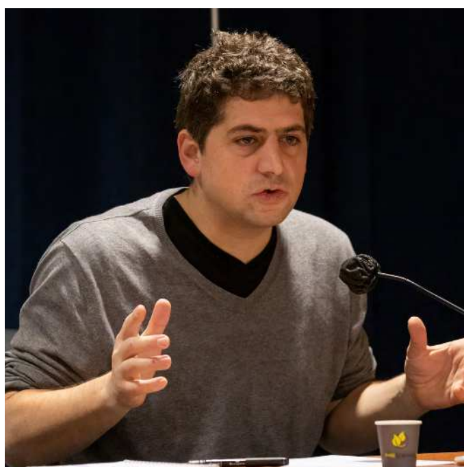
Michaël Zemmour, Économiste spécialiste des retraites